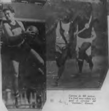
Carrera de 400 metros. En final muy fuerte que ganó el corredor del "Walden" "Walden".

Esta prueba del equipo "Walden" de al momento de ir en el estadio de los días.