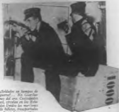
Soldados en tiempos de guerra... En Guadalupe del oro. Constatando del control en los Estados Unidos los millones de dólares, transportados de un banco a otro.

A las compañías bancarias de las grandes capitales modernas no les basta con las más caras de los bancos de oro. La imprevisión de los ladrones es cada vez más temible, y así muchos circuitos progresivos de día en día.