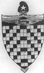
CRUCIGRAMA.—Por Lidy Nos Prada, Ciba del Agra