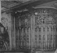
Una de las salas de la Mauretania, con sus muebles y decoración.