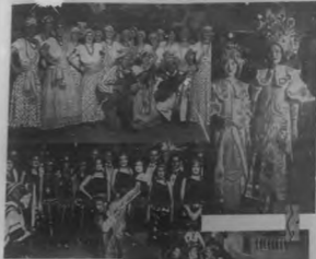
EL BARRIO DE LOS GIGANTES

Una gran multitud de gente en el barrio de los Gigantes. En el centro, se ve a un grupo de chicos que están jugando fútbol. En la parte superior, se ve a un grupo de chicas que están bailando. En la parte inferior, se ve a un grupo de chicos que están jugando fútbol.