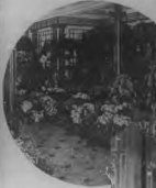
Una de las salas de la Mauretania, con sus muebles y decoración.