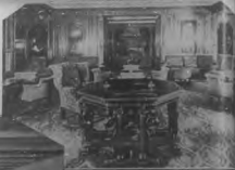
El salón de la Mauretania, el más grande y cómodo que se haya jamás visto en un buque.