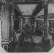
Una de las salas de la Mauretania, con sus muebles y decoración.