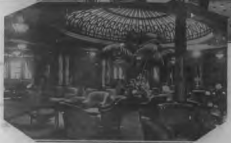
Una de las salas de la Mauretania, con sus muebles y decoración.