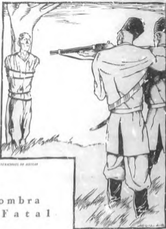
ESPIONAJES DE AUSTRIA