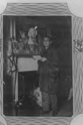
FRANCIS DE MIOMANDRE en su casa.